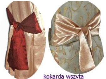
kokarda wszyta i związana