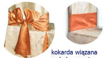
kokarda wiązana wokóło oparcia